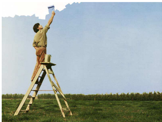
Hans Citroen Het Blauwe van de lucht , 1976 Fotografie Kunstuitleen Rotterdam